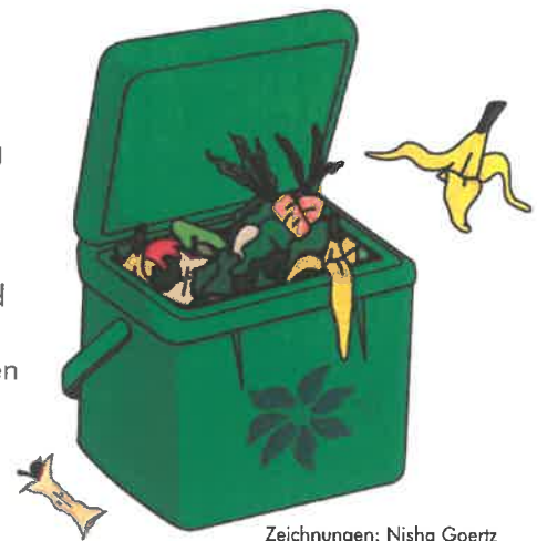
Zeichnungen: Nisha Goertz

Um das Biogut, wie z.B. Kartoffelschalen, Obst- und Gemüsereste und Kaffeefilter kompostierbar zu entsorgen, sind Plastiktüten nicht empfehlenswert. Benutzen Sie lieber Küchenkrepp, da es sich für einen späteren Kompostierungsvorgang gut zersetzen lässt.