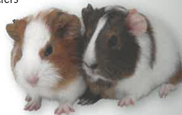
Rierner Info 2/2017

oder auf bestimmte Kleintiere, besitzen die anderen Mieter ebenso ein Recht, beispielsweise vor gefährlichen Tieren oder Lärmbelästigung geschützt zu werden. Der Vermieter muss im Einzelfall zwischen diesen unterschiedlichen Interessen einen Ausgleich schaffen. Deshalb ist eine Absprache mit dem Vermieter bei der Anschaffung eines Haustiers unumgänglich, um unnötigen Ärger zu vermeiden.